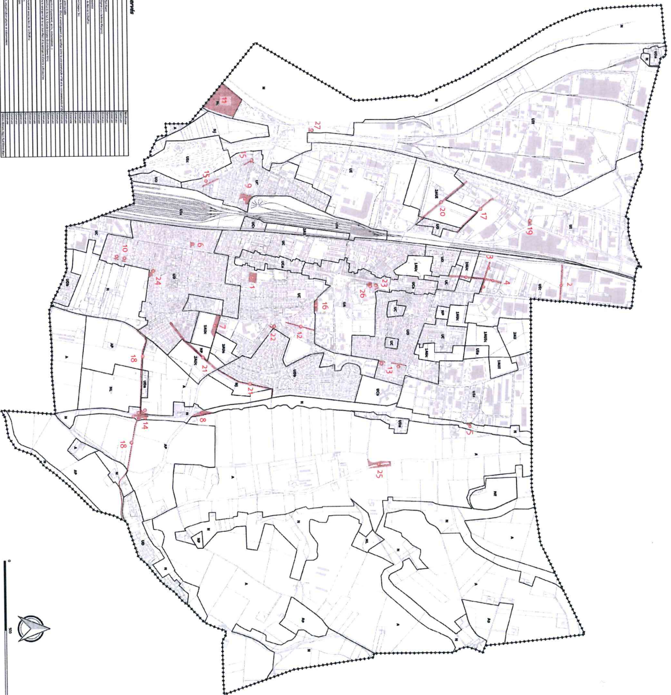
Liste des emplacements réservés